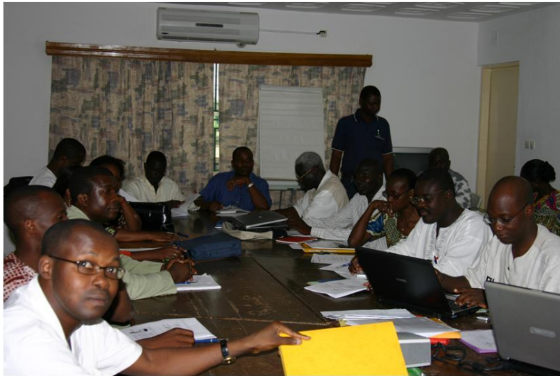
Le groupe d'experts togolais, Atelier AlterSanté VIH et paludisme, Lomé mars 2007.

Etant donné les interactions évidentes, entre le VIH et le paludisme, et en accord avec les recommandations de l'OMS, le groupe a convenu de l'importance de coordonner les actions de lutte contre ces deux maladies, et d'évaluer les actions de prévention et de traitement par de la recherche opérationnelle.